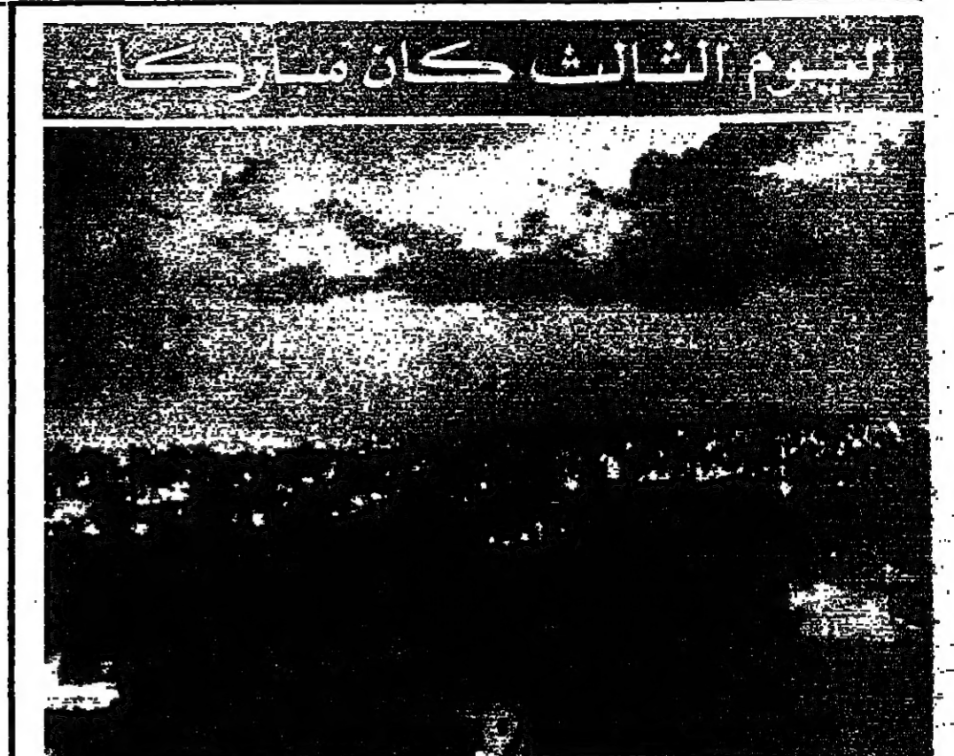
التيوم الثالث كان ماركيا برق ورمع وسحب سؤداء فوق بيروت مساء امس... هذا هو اليوم الثالث للهبة الخفية ويبدو انه يوم مبارك... مسرعة وترق... والخرخر المشغلا لغير... هذا ما قاله الوزير لسانوني في اتصال هاتفي اجراه مع التلفزيون مساء امس... واصاف: ومن حيث الجن... في هذه اللحظة دقيقة بكل مكان... مساعدا نقل هاتفي لانه كل ما يحدث... برق ورمع وسحب سؤداء فوق بيروت مساء امس... هذا هو اليوم الثالث للهبة الخفية ويبدو انه يوم مبارك... مسرعة وترق... والخرخر المشغلا لغير... هذا ما قاله الوزير لسانوني في اتصال هاتفي اجراه مع التلفزيون مساء امس... واصاف: ومن حيث الجن... في هذه اللحظة دقيقة بكل مكان... مساعدا نقل هاتفي لانه كل ما يحدث...

...حضر السنوَاب ومعه الرشاشات التواب الذين نزلوا الى المجلس امس... وعندهم كان مسلحا... وكان يحمل رشاشا والبيض الاخر كان يحمل مسكنا... ومن لم يكن يحمل سلاحا كان يصطحب مرفقين مسلحين... كل ذلك كان من قبيل التصيب... بعد حادثة وصول بعض المسلمين الى ساحة البرلمان اتاه تواجد التواب رئيس المجلس المنصوب... الا ان المسلمين الى هم المجلس... ولم يكمل التصيب لعدم الجلطة التي كانت بقررة امس... ونكر ان التواب الذي اتاه التواجد على وقف اطلاق النار والمساكن التي كانت مبنية امس لتثبيت هذا الاتفاق... هي التي ادت الى تجييل جلسة المجلس التي موعدهم ان يفتتحها بعد الاتفاق... شوه التطورات المستجدة بعد الاتفاق الاخير... (التفاصيل على الصفحة ٢)